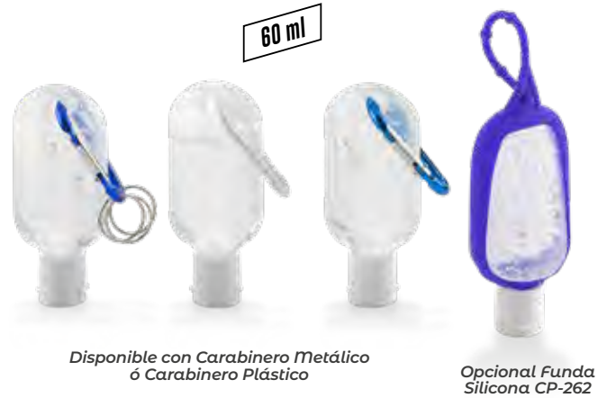
Disponible con Carabinero Metálico ó Carabinero Plástico

Medidas: 60ml: 11.5 cm X 5.2 cm 120ml: 14 cm X 3.8 cm diámetro 300ml: 16 cm X 6.2 cm X 4.7 cm 500ml: 18.5 cm X 7.5 cm X 5.5 cm 1000ml: 23.5 cm X 9.3 cm X 7.5 cm 4000ml: 24 cm X 19 cm X 13 cm Marca: 5 cm / Tampografía / Litografía (Cotización especial) Marca 4000ml: Sin marca