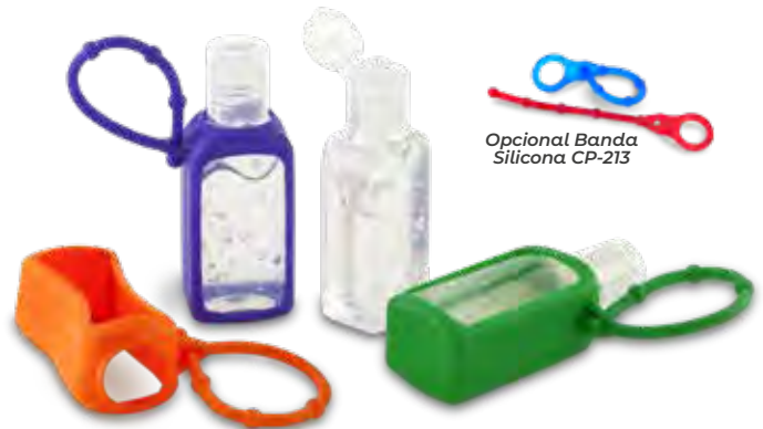
Opcional Banda Silicona CP-213

Medidas: 9 cm x 3 cm diámetro inferior Marca: 2 cm / Tampografía