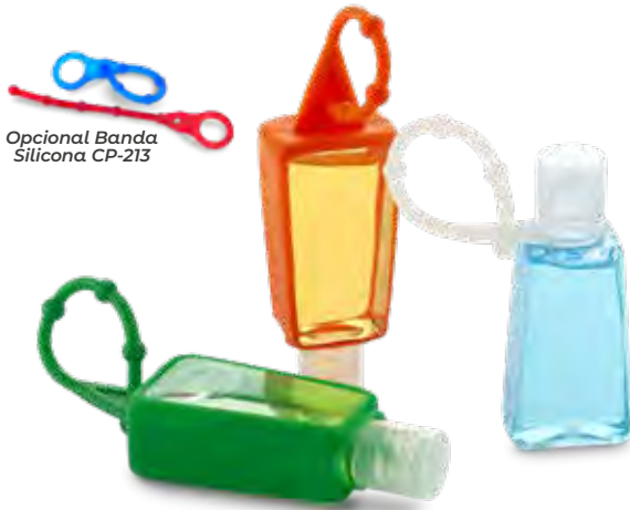
Opcional Banda Silicona CP-213